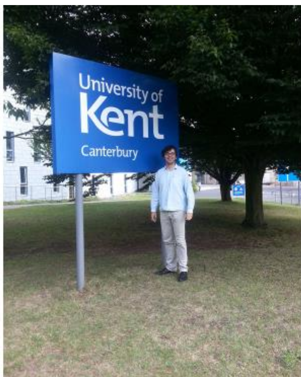
Program probíhal na Univerzitě Kent nedaleko od Canterbury